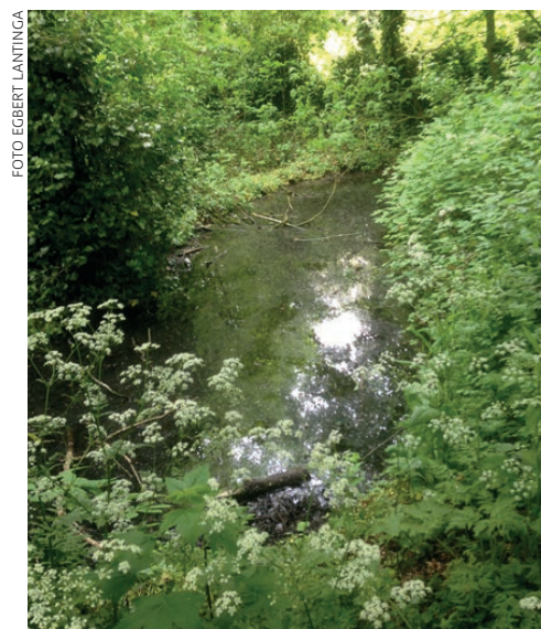
Foto 3: restant poortgracht, te zien langs pad vanaf (rechts naast) Geerteshuis in de Jachthuisstraat naar de Moerpitwei en het voetbalveld

Van het oude Breda is overgeleverd dat zich ook daar het gasthuis net buiten de omringende gracht bevond, dit vanwege besmettingsgevaar. In dit verband moeten we nog iets bijzonders van het oude Kloetinge noemen en dat is de Oostkeure. Hiermee werd het gebied aangeduid