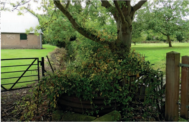
Foto 1: restant poortgracht, te zien vanaf dreef tussen Noordeinde 4 en 4a

dr, weduwe van Lodewijc van der Maelstede. Gelet op de genoemde oppervlakte in de akte (omgerekend 1,9 ha) en de ligging ervan in het outdorp gaat het hier om de vrone De Oude Vijverboomgaard met daarin de hoogwerf Het Wal ten oosten van het Marktveld en twee percelen aan de noordoostkant van de Nieuwstraat (perceelnummers 326 en 328 op de plattegrond). Een vrone is een stuk land waarop reeds in het midden van de 14e eeuw bebouwing stond en waarover later geen belasting betaald hoefde te worden. Van deze hoogwerf is uit een verkoopakte van 1627 bekend dat hierop toen nog een middel-eeuws torentje stond. Dit betreft Het Steenhuus van Cloetingen binnen sinen voersten graften dat de Kloetingse ambachtsheer Dirk Klaaszoen in 1356 had opgedragen aan Hertog Willem II en vervolgens in erfleen terugkreeg. In 1453, dus een kleine eeuw later, verkocht zijn kleinzoon Gillis Klaaszoen het geheel aan Hendrik II van Borsele: Klaas Hijmanszoen, geestelijke en openbaar notaris te Goes, oorkondt dat Gillis Klaaszoen uit Cloetingen aan Hendrik II van Borsele, heer van Veere enz., heeft verkocht een omgracht (' circunvallata ') kasteeltje (' quoddam fortilicium ') met aangren-