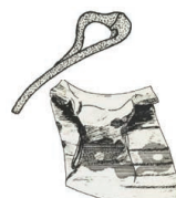
Pingsdorf aardewerk met rode aardverversiering