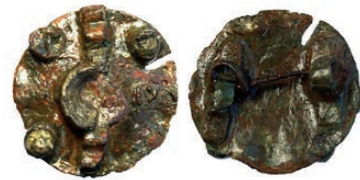
Voor- en achterzijde van de schijffibula (resp. links en rechts)

Een aantal jaren geleden is bij archeologisch onderzoek aan de oostkant van Abbekinderen de fundering blootgelegd van een huis uit rond het jaar 1000. Tevens werd toen een bijzondere versierde schijffibula, oftewel mantelspeld, gevonden met resten van sierstenen op de voorkant en compleet met naald aan de achterkant (zie foto's). Tot op heden is dit de oudste vondst binnen de grenzen van de parochie Kloetinge. De archeologen dateerden deze fibula namelijk uit de periode van de 9de tot en met de 10de eeuw.