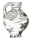
Geglazuurde, roodbruine kan met gele slijbversiering gevonden in de waterput bij de kerktoeren (tekeningen B. Oele)