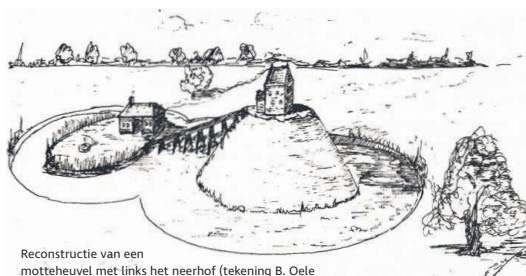
Reconstructie van een motteheuvel met links het neerhof (tekening B. Oele)