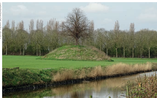
De motteheuvel bij Blaemskinderen

de andere ten zuiden daarvan bij het voormalige gehucht Blaemskinderen (zie foto).