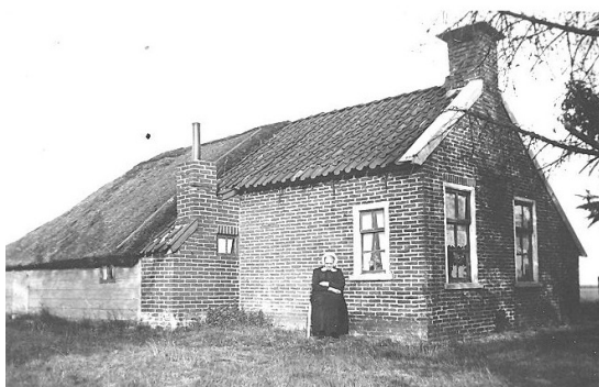
Eikenlaan 139, Blesdijke (ca 1943)