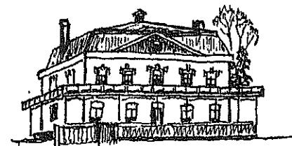
Villa Claus Kloetinge "Mon Retrait"