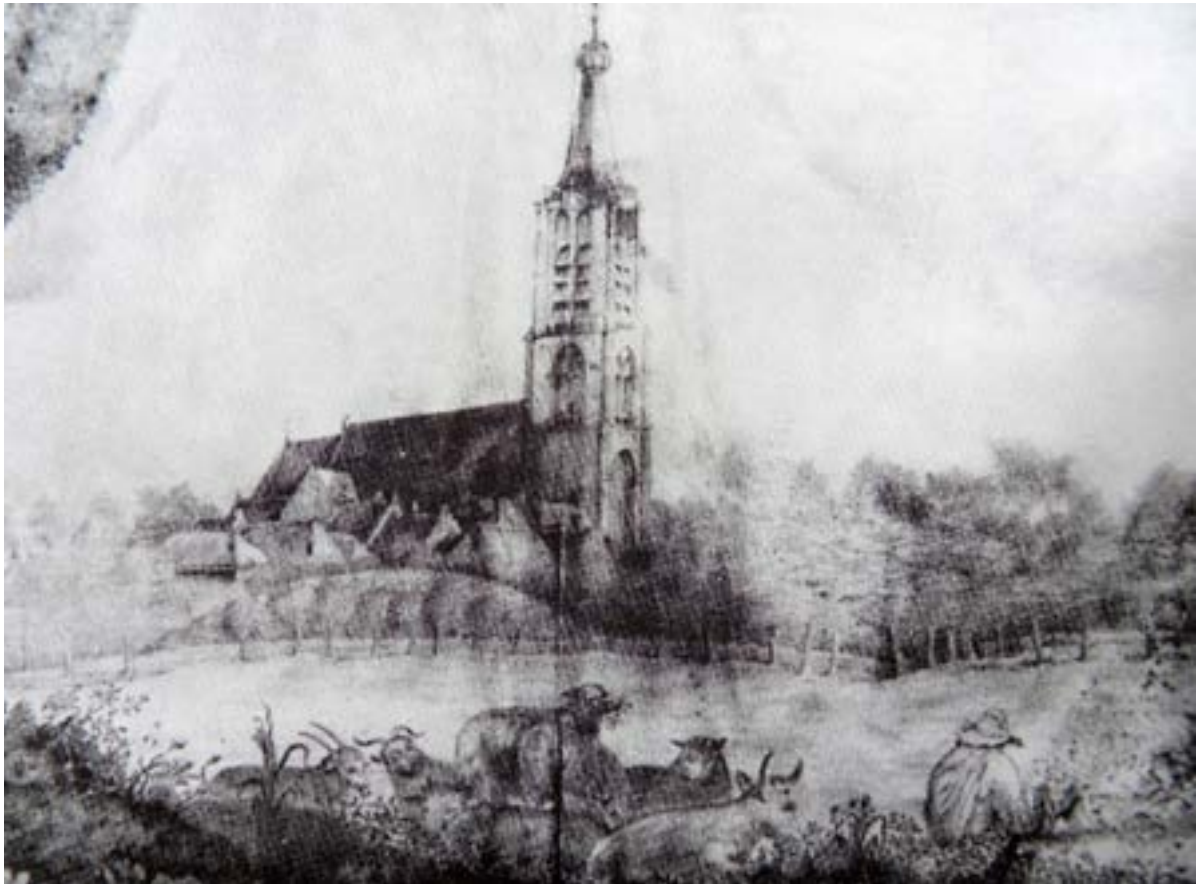
Dorpsgezicht Kloetinge met de Hemberg en langs de bomenrij de schuitvaart tussen Kloetinge ( 't Ouwe Veeruus aan het Noordeinde) en de Voorstad van Goes (ca 1610)