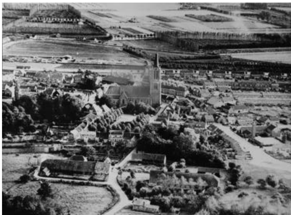
Luchtfoto van Kloetinge (ca 1962): linksonder Hofstede Ravenstein met daarvoor in de bocht van het Noordeinde het weiland waar eertijds het Noordhof en 't Slot hebben gestaan.