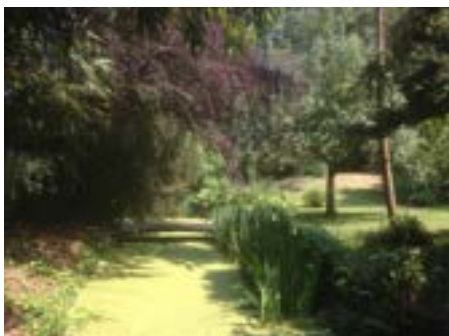
De Poortgracht ten ZW van hoogwerf 't Wal (2016)

Van het oude Breda is overgeleverd dat zich ook daar het gasthuis net buiten de omringende gracht bevond, dit vanwege besmettingsgevaar. In lijn hiermee moeten we nog iets bijzonders van het oude Kloetinge noemen en dat is de Oostkeure . Hiermee werd het gebied aangeduid waarbinnen later de zuidelijke tak van de Nieuwstraat (nu Jachthuisstraat) lag. In Kloetingse belastingregisters uit de 17de en 18de eeuw beginnen de lijsten van hoofdbewoners steevast met die van de Oostkeure en de oostzijde van de Nieuwstraat gezamenlijk. Deze aparte vermelding moet een reden hebben gehad en wij hebben daarom een sterk vermoeden dat dit later bebouwde gebied zich eertijds buiten de poortgracht, en dus ook buiten de oorspronkelijke dorpskom, bevond. Dit wordt ondersteund door een soortgelijke situatie in het middeleeuwse Sluis. Daar was zelfs sprake van zowel een Oostkeure als een Zuidkeure. Ze werden zo genoemd omdat zij oorspronkelijk ten oosten en ten zuiden van (en dus buiten) het rechtsgebied van de schepenen lagen.