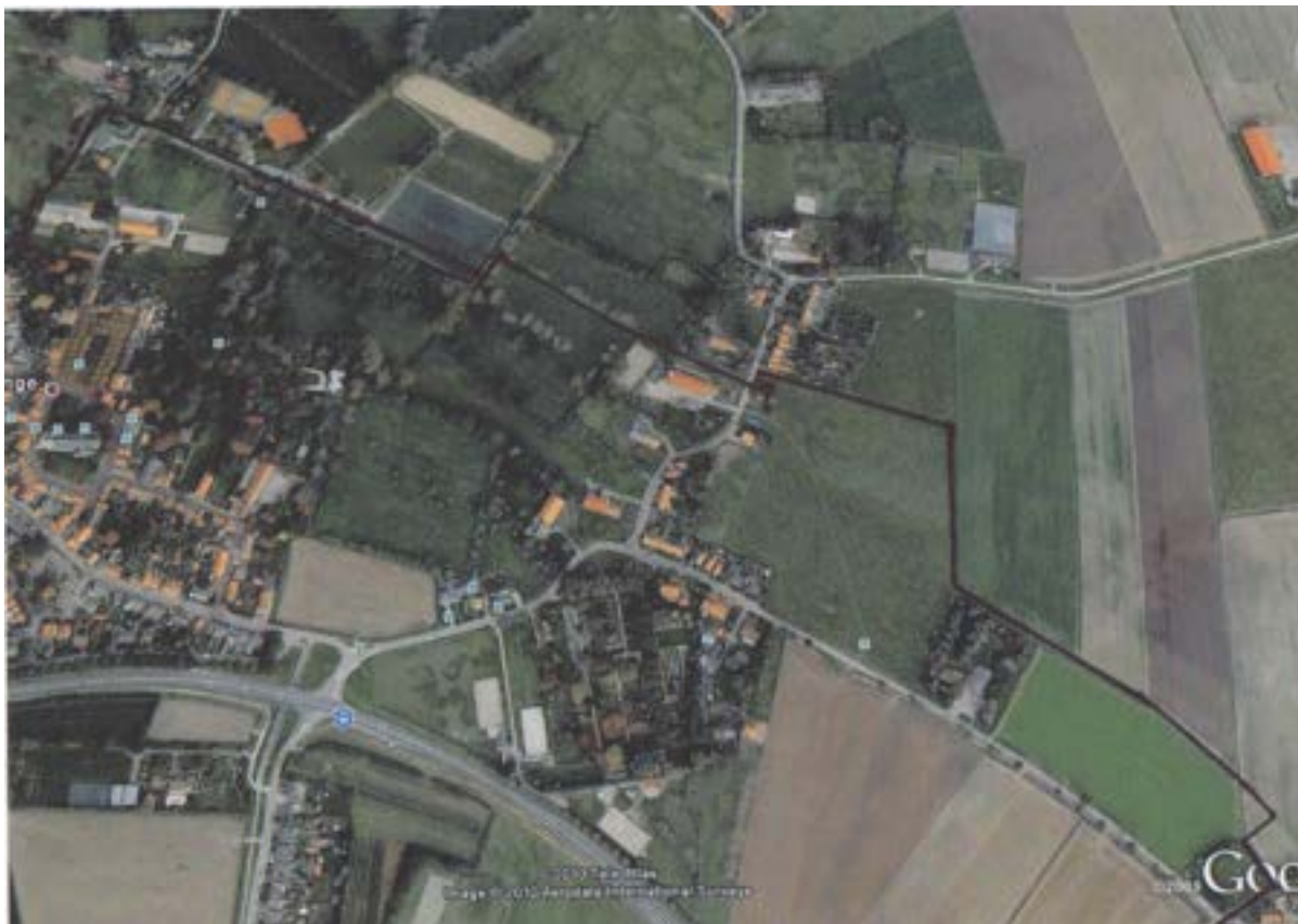
De schuitvaart van Goes via Kloetinge naar Kapelle (tweede deel aangelegd ca 1600)